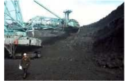
FIGURE 23.3. Un tractopelle broutant de très vieilles feuilles.

L'économiste Jevons a fait un calcul simple en 1865. Les gens débattaient du temps que durerait le charbon britannique. Ils avaient tendance à répondre à cette question en divisant la quantité estimée de charbon restant