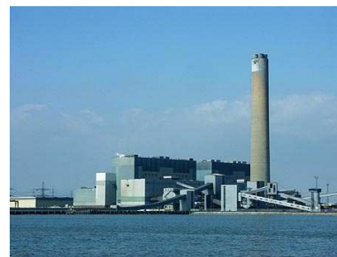
FIGURE 23.1. Charbon en cours de livraison à la centrale de Kingsnorth (d'une capacité de 1 940 MW) en 2005.