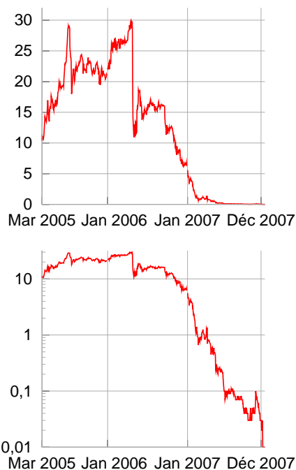
FIGURE 29.1. Nous voilà bien avancés ! Le prix, en euros, d'une tonne de CO 2 durant la première période du plan européen de quotas d'émissions.

La politique énergétique de Grande-Bretagne n'est tout simplement pas à la hauteur. Elle n'apportera pas la sécurité. Elle ne permettra